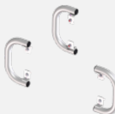
Tragegriffe 4-teilig 5088930001