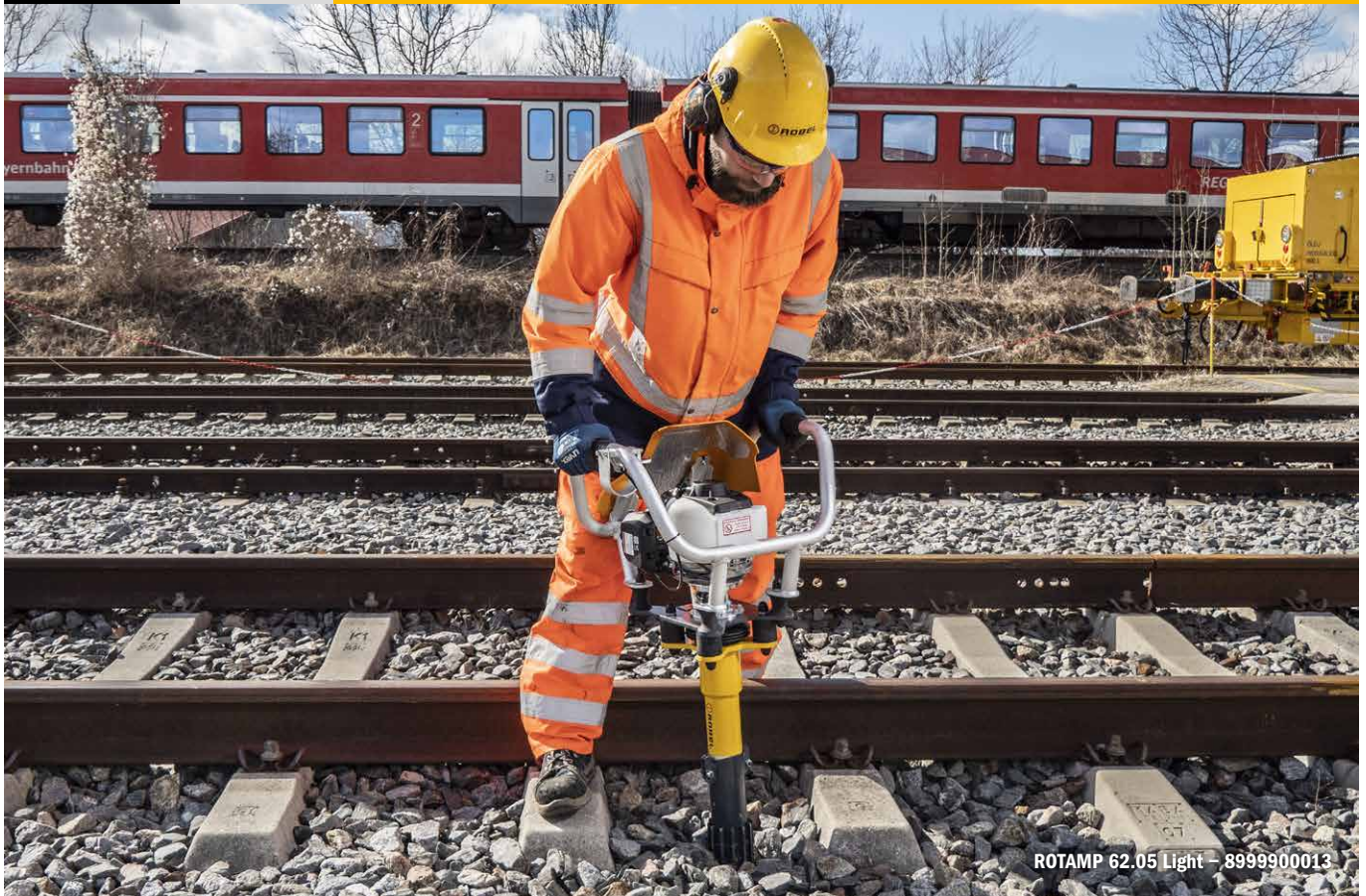
ROTAMP 62.05 Light – 8999900013