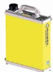
Akku 2300 Wh - 7839900001