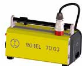
Netzteil 400 Volt - 5039900003