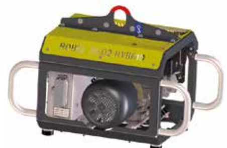
ROPOWER 70.02 - 5029900002